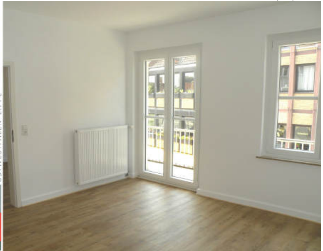
Gemütliche 2 Zi.-Wohnung in der Fußgängerzone von Bad Salzufen.